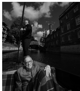
ケム川から