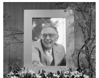
お別れの会 青山葬儀場にて

4月、青山葬儀場で「お別れの会」が行われ、キーン先生を慕う大勢の人々が別れを惜しみました。